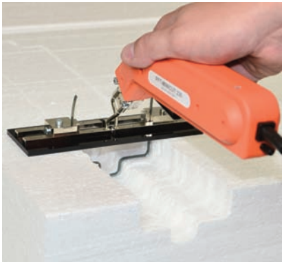
Frei wählbare Formen, z. B. Nut- schnitte entstehen durch einfaches Biegen des Schneide-Bands.