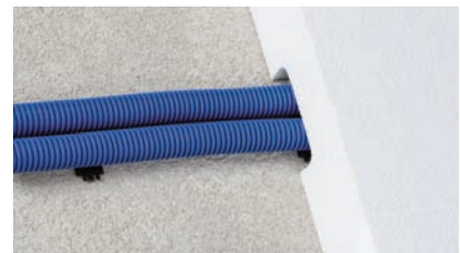
... zur Verlegung eines Leerrohrsystems.