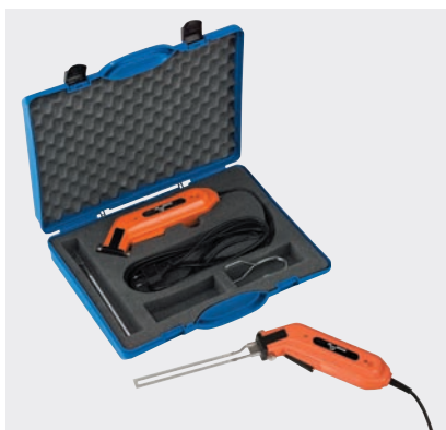
PFT MINICUT 140 mm im Koffer