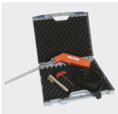
PFT MINICUT 230 mm im Koffer